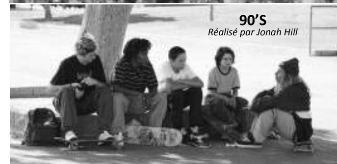
90'S Réalisé par Jonah Hill