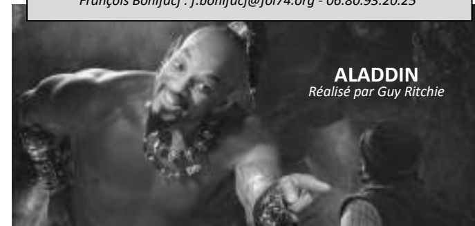
ALADDIN Réalisé par Guy Ritchie