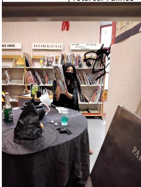
Le banquet des Monstre, 29 octobre 2021